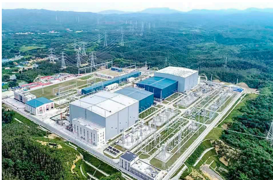
Station de conversion d'électricité en Chine

Les nouvelles stations de conversion seront les plus grandes jamais réalisées dans le monde et permettront de garantir un approvisionnement sécurisé de la région de la Grande Baie de Guandong - Hong Kong - Macao.