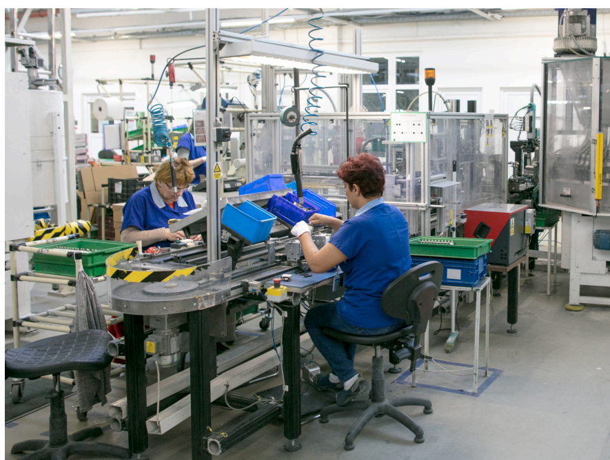
Atelier de fabrication de fusibles

Cette usine, qui emploie environ 300 salariés, produit des fusibles industriels à coûts compétitifs pour le marché européen.